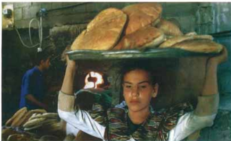
una ragazza di Betlemme trasporta del pane

Il parroco, gli artigiani e tecnici operatori